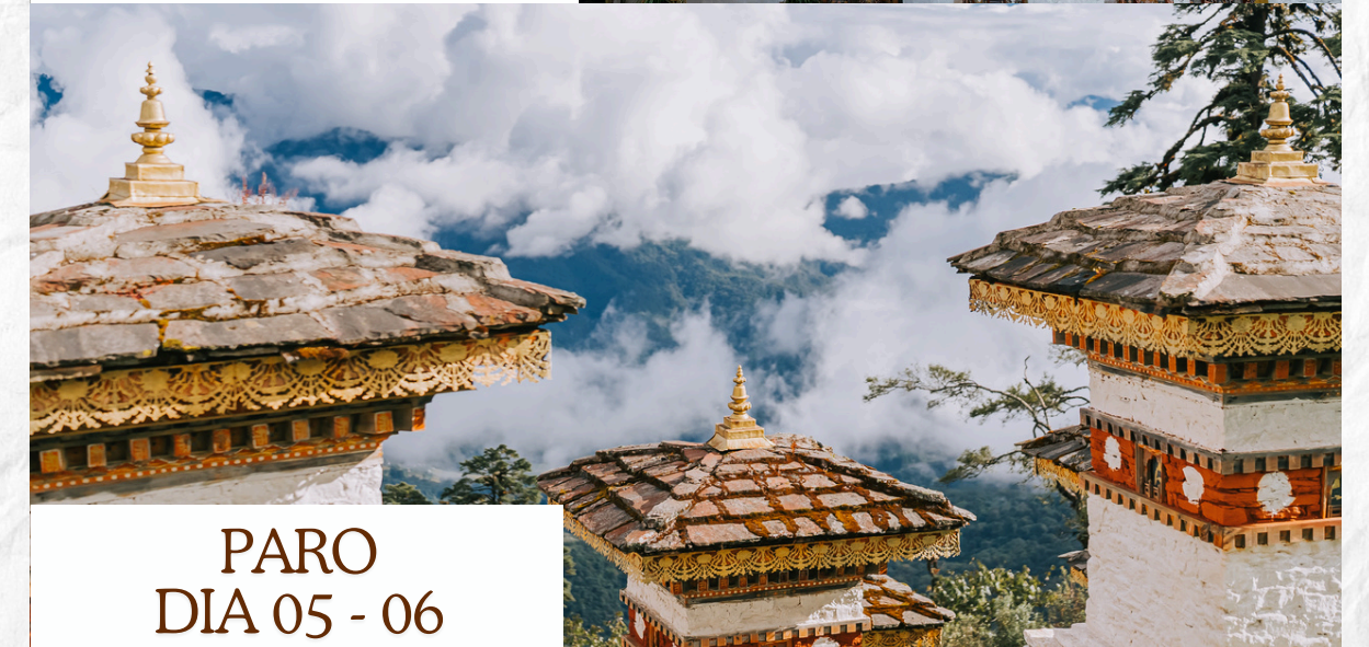
PARO DIA 05 - 06