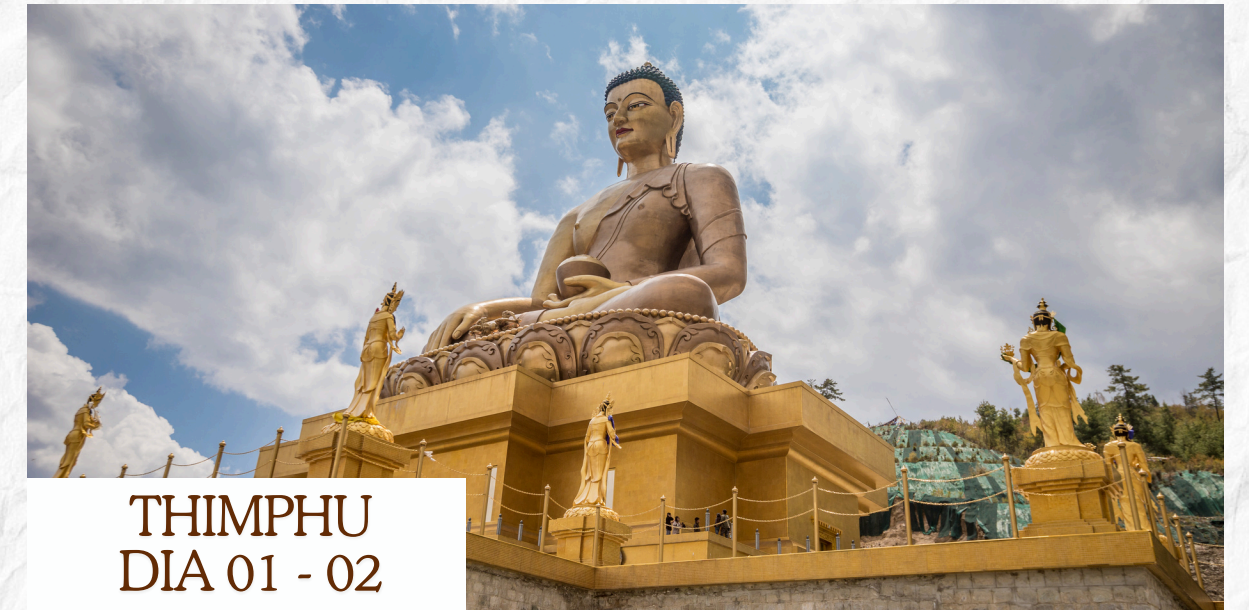
THIMPHU DIA 01 - 02