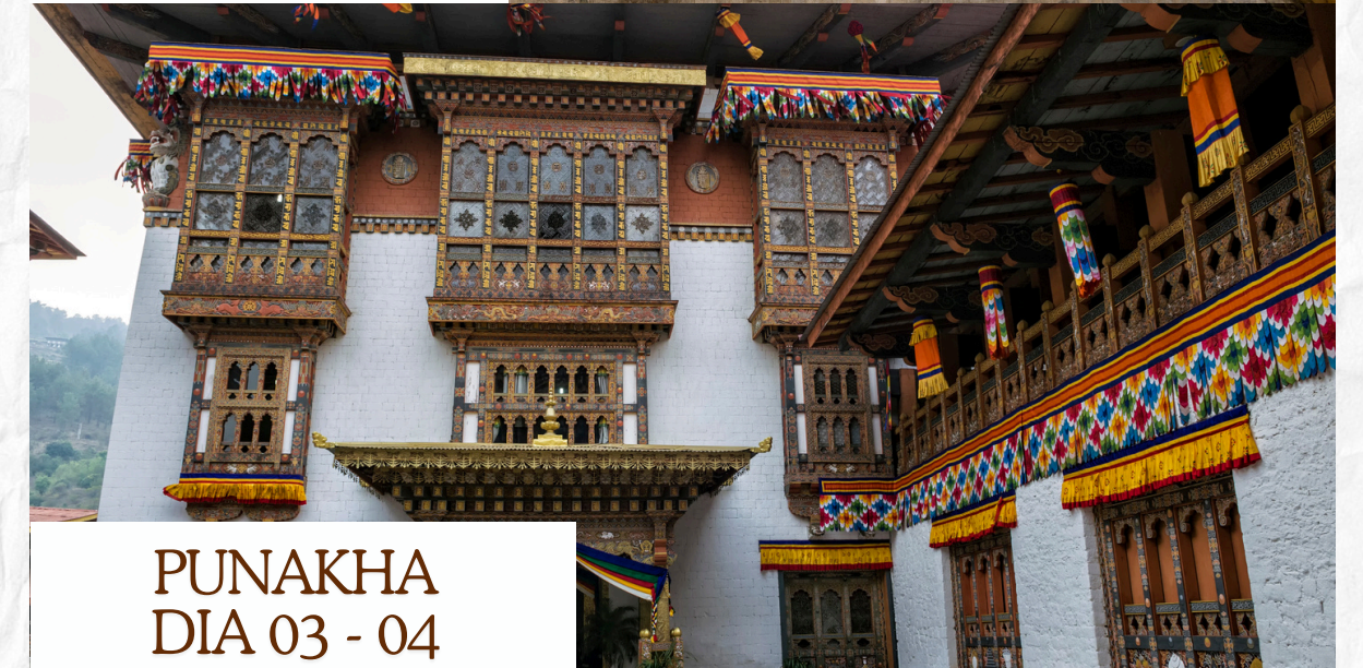
PUNAKHA DIA 03 - 04